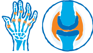
Rheumatoid Arthritis (RA) Inflamed and swollen synovial membrane