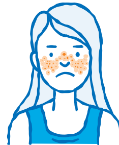
Lupus Skoenlapper uitslag